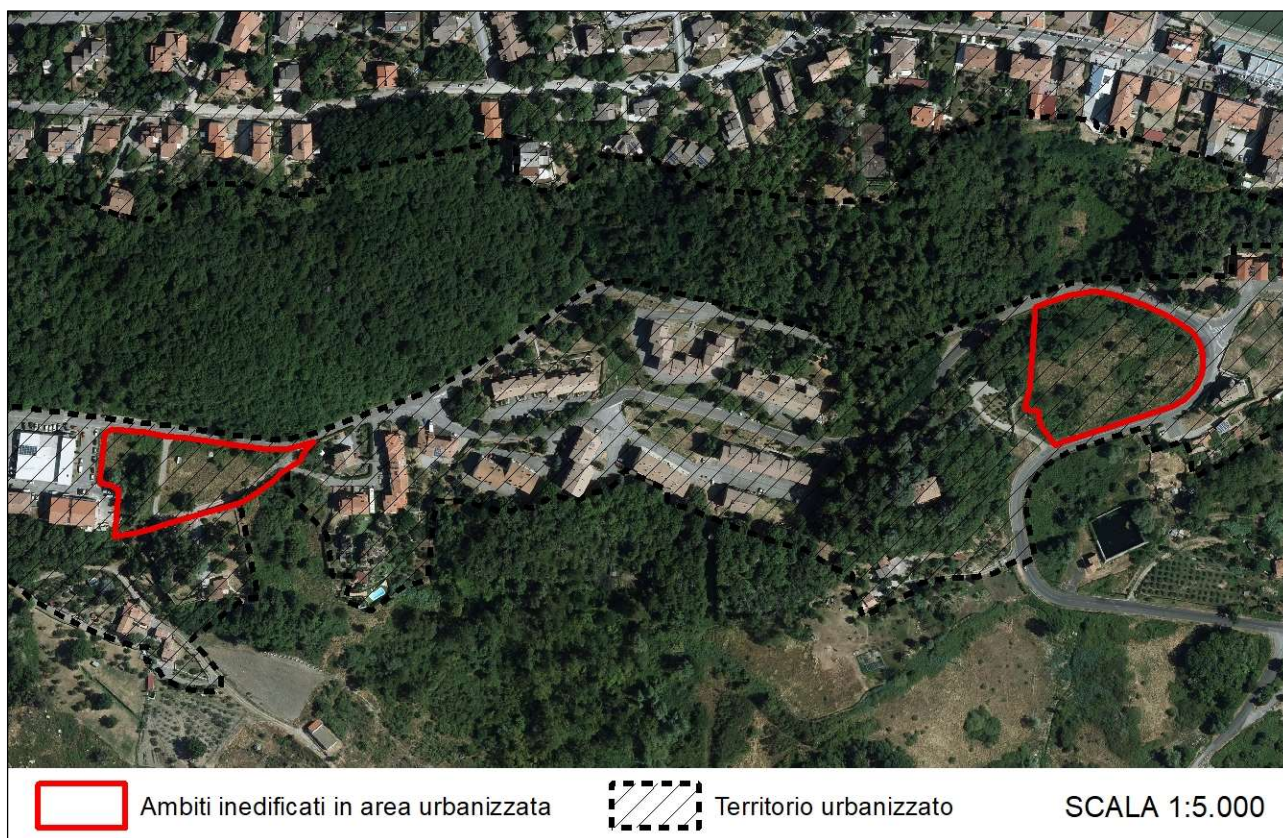
Piano strutturale. Ambiti inedificati in area urbanizzata

Tale scelta discende dalla presa d'atto dell'assenza, all'interno del territorio urbanizzato, di aree compatibili, per caratteristiche e dimensioni, alla realizzazione del polo attrezzato.