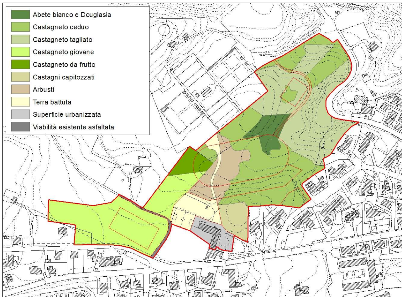
Caratteristiche della vegetazione forestale presente nelle aree interessate dalla Variante.

L'area interessata dalla variante, localizzata nell'area compresa fra il Cimitero e il Santuario della Madonna di San Pietro, risulta quasi interamente boscata.