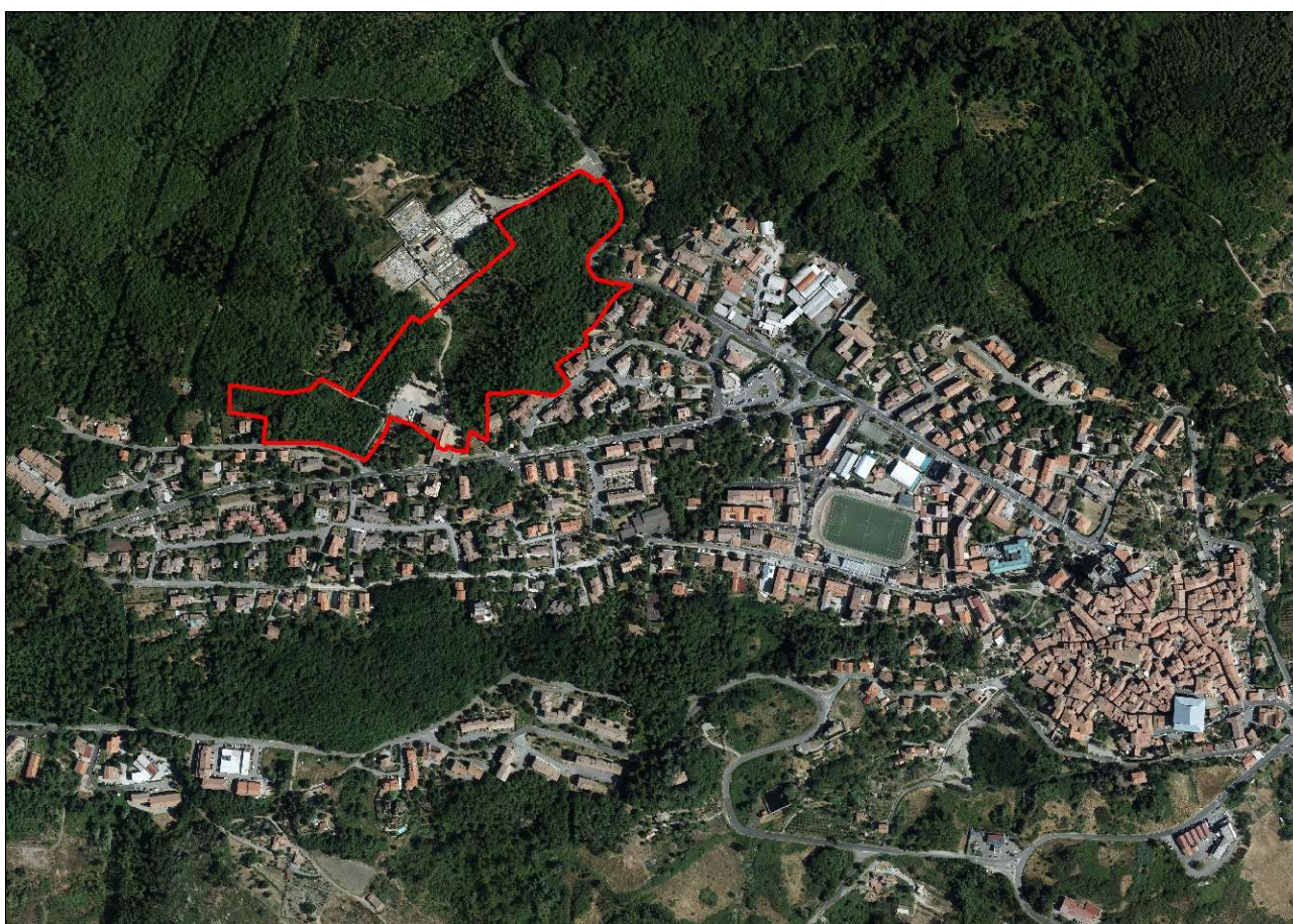
Centro abitato di Piancastagnaio. Inquadramento territoriale con indicazione dell'area interessata dalla variante, scala 1:10.000.